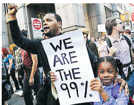
2011年佔領華爾街運動中，有示威者手持「我們是99%」的標語，抗議窮人受剝削。